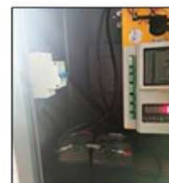
BACKUP BATTERY KEEPS BARRIER RUNNING LWHILE POWER OFF