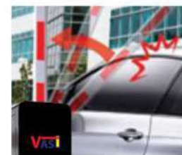
BOOM AUTO-REVERSE ON OBSTACLE, PROTECT VEHICLE