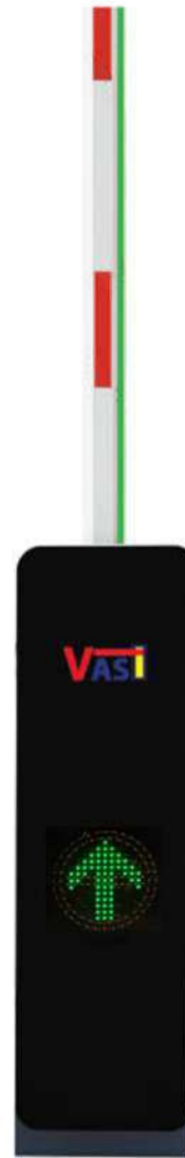
แขนไม้กั้นเปิดไฟสีเขียว(↑)