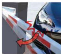
BOOM SWINGS OFF AGAINST HIT, PROTECT BOOM & CAR