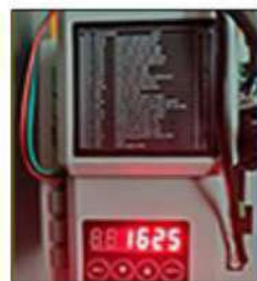
MUTI-FUNCTION CONTROL SYSTEM WITH LED DISPLAY