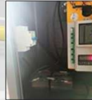
BACKUP BATTERY KEEPS BARRIER RUNNING WHILE POWER OFF