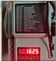
MUTI-FUNCTION CONTROL SYSTEM WITH LED DISPLAY