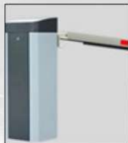
BOOM SWINGS OFF AGAINST HIT, PROTECT BOOM & CAR