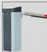
BOOM SWINGS OFF AGAINST HIT, PROTECT BOOM & CAR