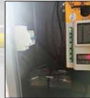
BACKUP BATTERY KEEPS BARRIER RUNNING LWHILE POWER OFF