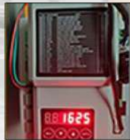
MUTI-FUNCTION CONTROL SYSTEM WITH LED DISPLAY